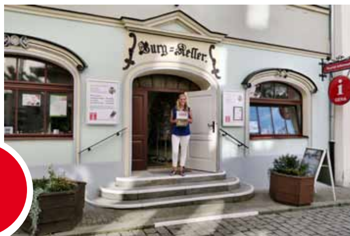
Der historische Burgkeller am Markt 1a – einst zünftige Bierstube, heute das Domizil der Gera-Information.

Ihre Tourist Information im Historischen Burgkeller Markt 1a 07545 Gera ☎ 03 65 8 38 - 11 11, Fax 03 65 8 38 - 11 15 tourismus@gera.de | www.gera.de/tourismus